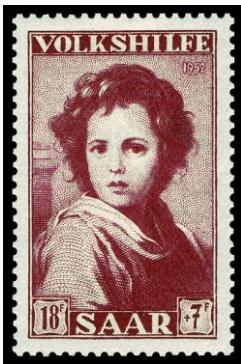
Sello del cuadro "El Buen Pastor"

En honor a este artista que ha dejado al mundo numerosas pinturas, no sólo religiosas, sino también costumbristas, se han bautizado calles, plazas e incluso jardines, se han fabricado sellos en su honor..... Existe en Sevilla una casa museo dedicada a este pintor.