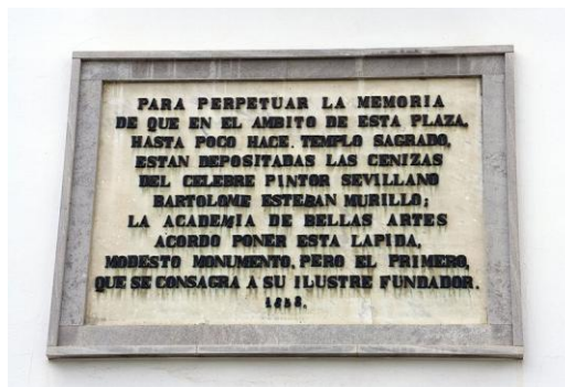
Placa conmemorativa en Sevilla