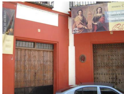
Casa Museo de Murillo en Sevilla.