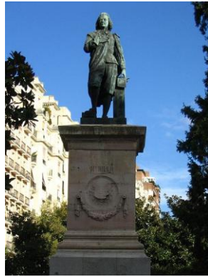
Estatua de Murillo en Madrid

Murillo fue muy querido, tanto en círculos cultos como populares.